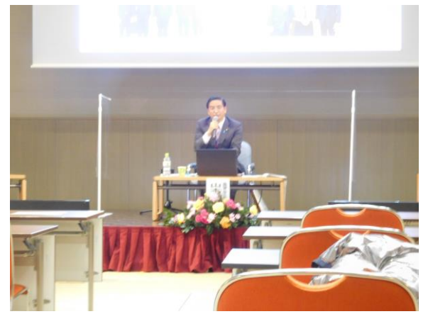
「あいサポートとっとりフォーラム2022」が開催され山本ひろし参議院議員が毎年参加