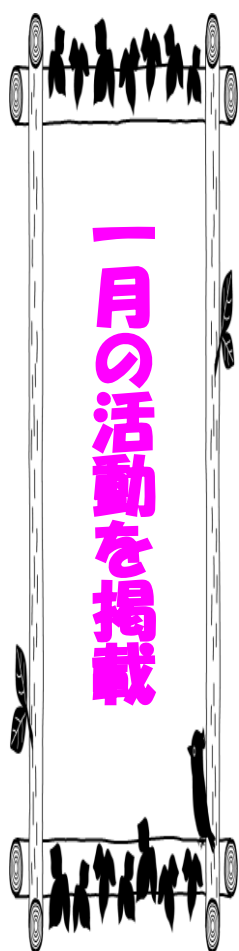
米子総支部街頭演説 1/4

18歳以下の子どもを育てる世帯に子ども1人当たり10万円相当を給付する臨時特別給付のうち、「5万円相当のクーポン給付」について「クーポンを基本として、地方自治体の実情に応じて現金給付も可能」とされ、10万円を現金で一括支給する方法も認められました。(裏面に続く)