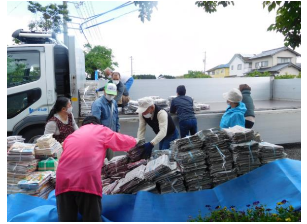
第54回古紙回収を実施!! (伯仙地区水鳥を守る会) 5/22

公明党は結党以来、目指してきたものがあります。それは「全ての人に教育の光を」との強い思いでした。それを、着実に推進し、様々な形で実現することができました。