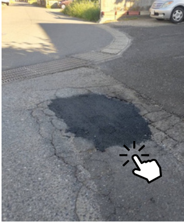
八街市大木 陥没していた道路を補修