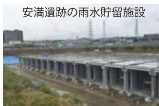
安満遺跡の雨水貯留施設