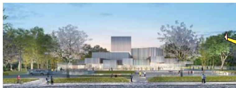
新市民会館イメージ図