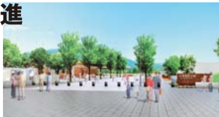
安満遺跡公園イメージ