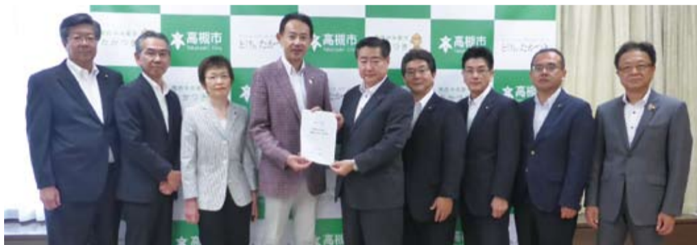
市長に29年度予算要望を提出した高槻市公明党議員団