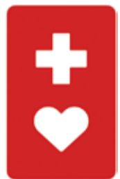
ヘルプマークのデザイン