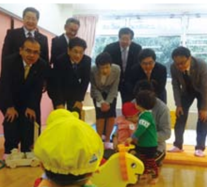
平成28年1月6日高槻市立臨時保育室を視察