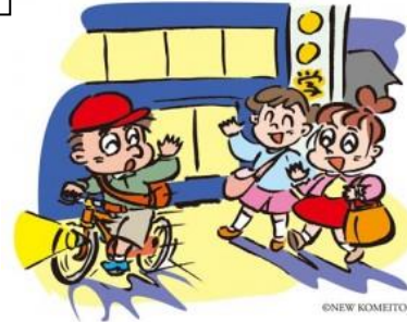
No.452 自転車も歩行者安心して（大手町）