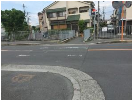
横断歩道が薄くなって危険とご指摘