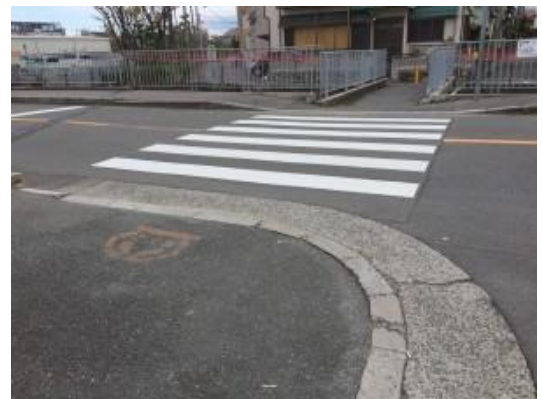
No.448 再塗装 安心・安全の前進（北大樋町）