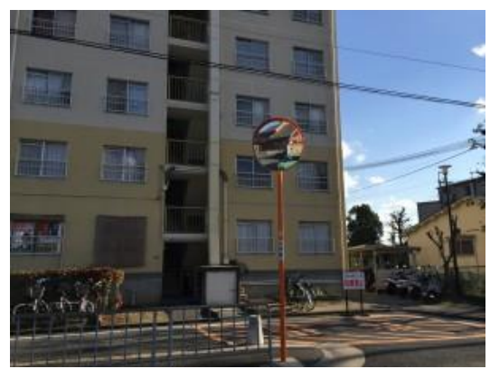
No.449 カーブミラー60cm⇒80cm（登町）