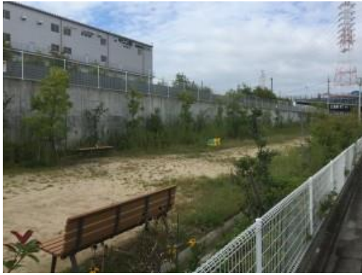
提供公園に雑草等が・・・