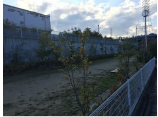
No.450 公園の除草・剪定（下田部町）