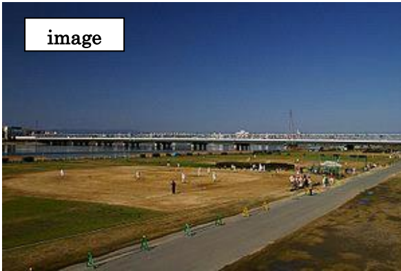
淀川河川敷のり面の除草依頼を・・・