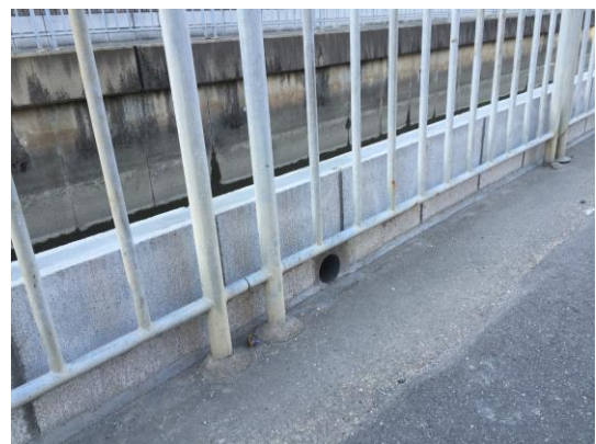
No.453 構造物のかさ上げで安心（北大樋町）