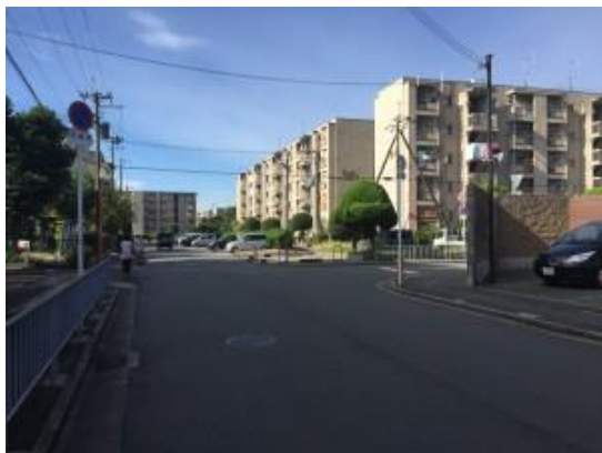
通学路・人通り・車通り・キケンと