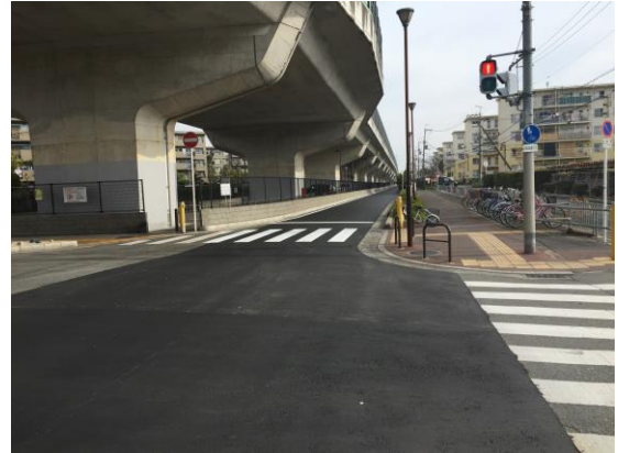
No.451 十三高槻線側道の再舗装（登町）