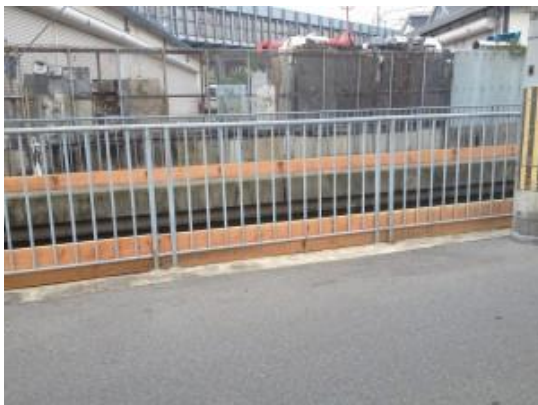
水路壁・木壁でかさ上げテスト効果確認