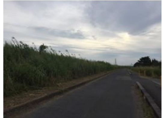
No.447 除草作業が進む（番田町）