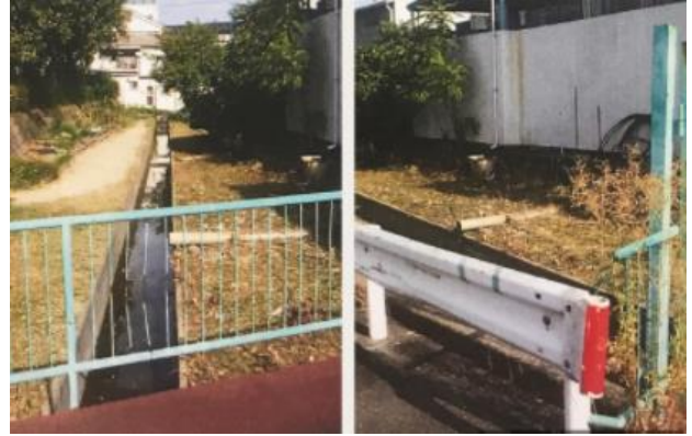
No.483 水路敷きの除草（登町）