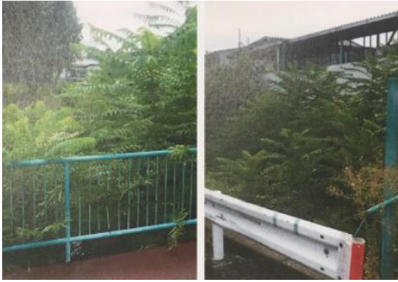
水路敷きの雑草が繁茂