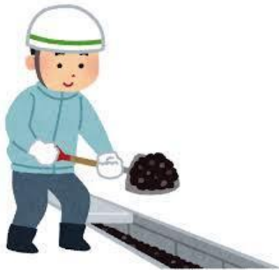
雨水の流れが悪くて・・・