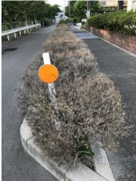
市道沿道の植栽が枯れています。補修を要望