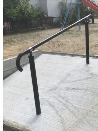
No.480 公園入口改善（辻子 3 丁目）