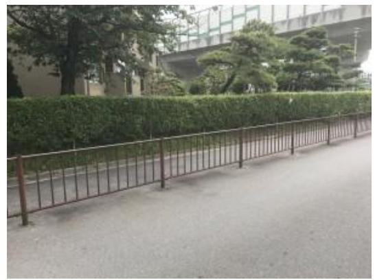
No.482 改修工事完了（登町）