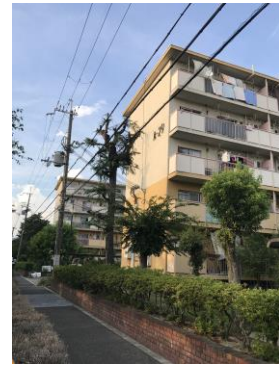
No.484 植栽補修は根が付く来年に実施決定（登町）