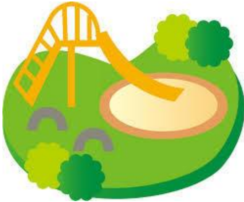
公園はみんなの憩いの場