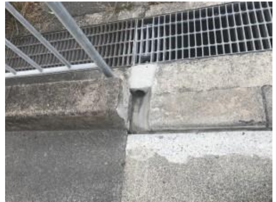
No.481 側溝改善・水溜り対策（深沢町）