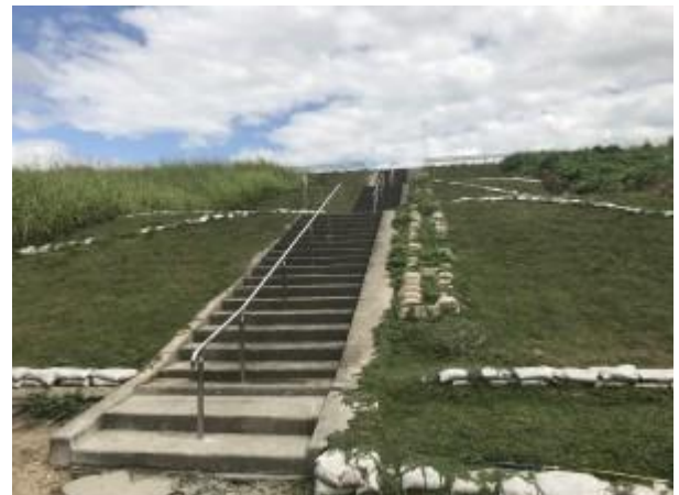
No.485 淀川堤防の階段に手すり設置（深沢本町）