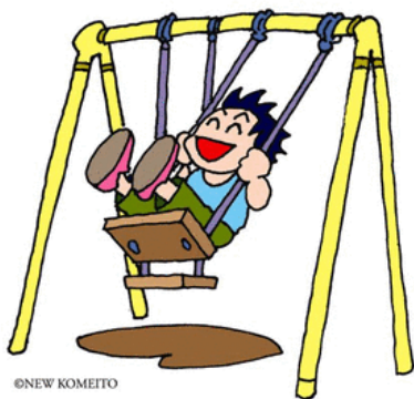
公園はみんなの憩いの場。心ある方が除草を