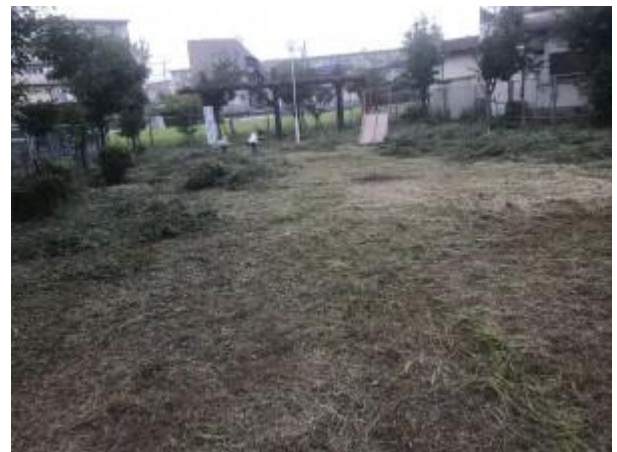
No.486 公園除草後の枯葉処理（登町）