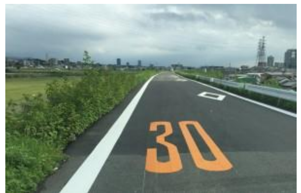
No.421 道路補修完成（大塚町）