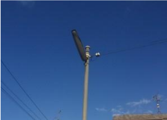
街路灯の老朽化・夜道が薄暗く不安