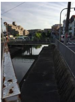
No.425 大冠中水路の清掃（登町）