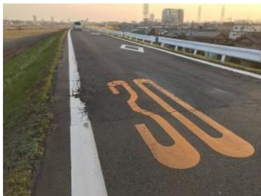
淀川堤防道路の亀裂や段差で震動が・・・