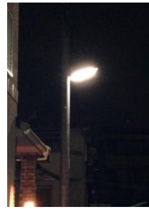
No.419 街路灯の接続完了（深沢町）