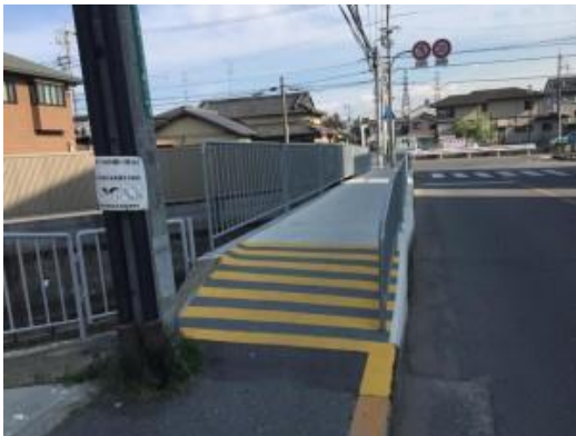
水路上歩道のスロープでの転倒防止策 追求