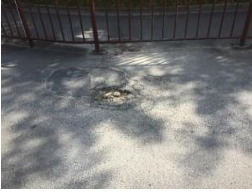
市道の穴ボコ危険