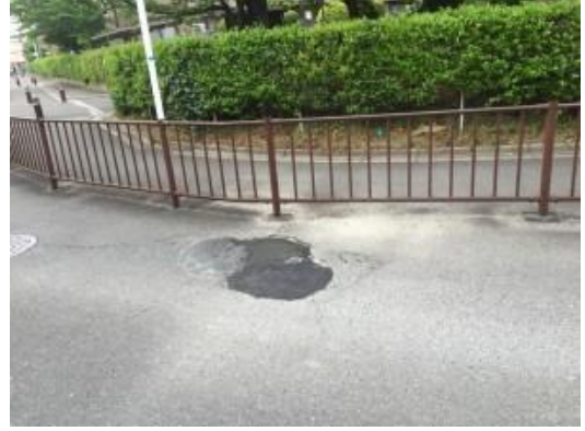
No.422 穴ボコの修理完了（登町）