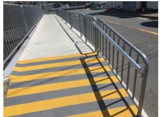
No.424 手すりを新設（大塚町）