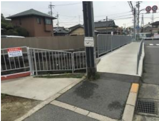
水路上歩道のスロープでの転倒がキケンのご指摘