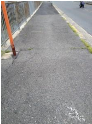
亀裂・凸凹の歩道はキケンです。