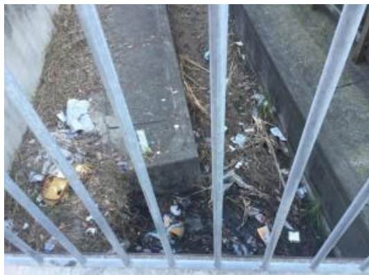
水路は水の道・ゴミを捨てる場所ではありません!!