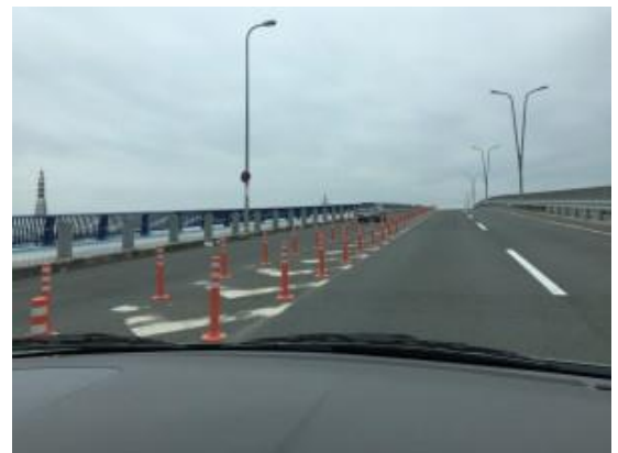
No.413 迷惑駐車対策 (堤町)