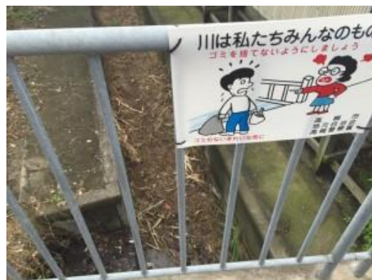
No.416~417 清掃と啓発看板（登町）