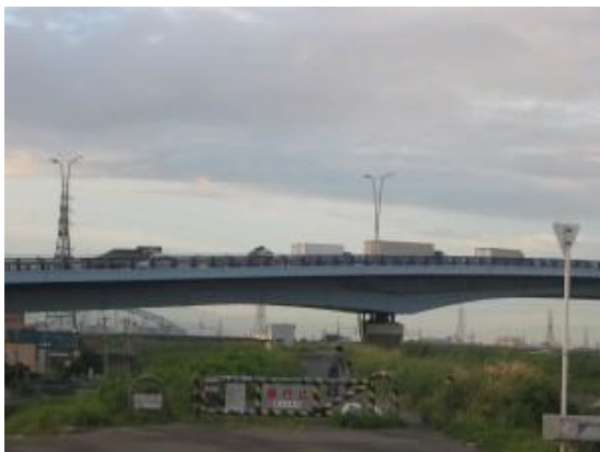
困ったものですね!!