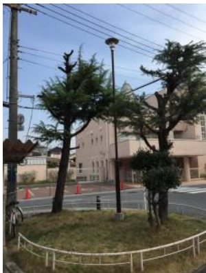
樹木の枝が邪魔をして照度が行き届いていません