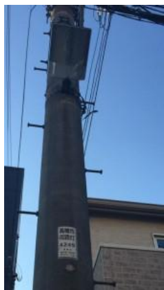
片方だけしか点いてなく、夜道がキケン