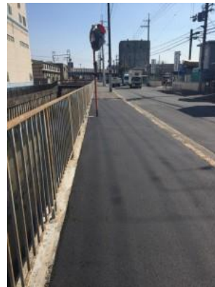
No.414 歩道の改修工事完成（西冠3丁目）