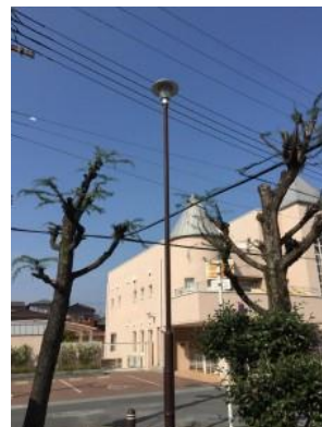
No.415 樹木剪定で照度を確保（登町）