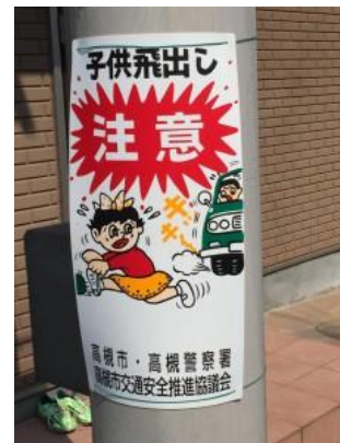
No.412 子ども飛び出し注意の啓発(北大樋町)