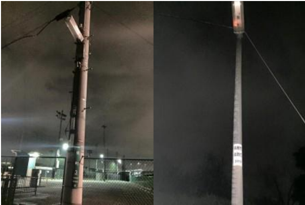
街路灯 2 箇所の玉切れのご連絡を頂き即現地へ

高槻市登町2番A31-402 高槻市議会議員 吉田章浩 TEL:675-5711