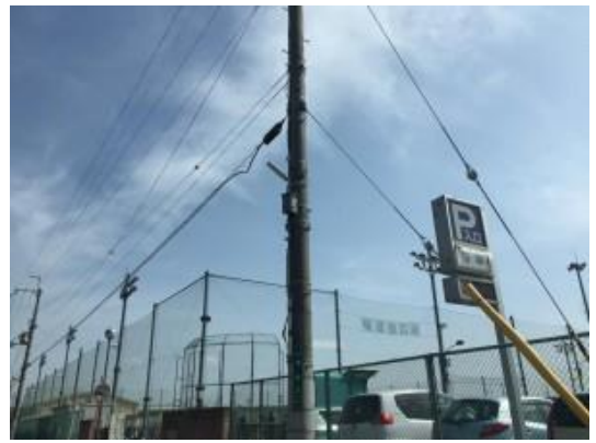
No.411 街路灯の修理完了 (堤町)