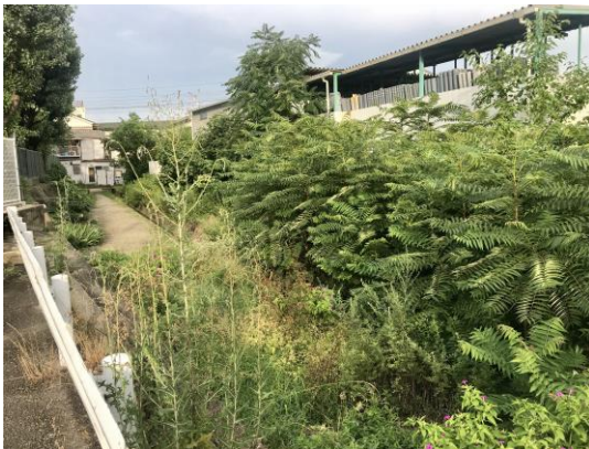
桜台小前・水路敷の除草と樹木伐採要望を