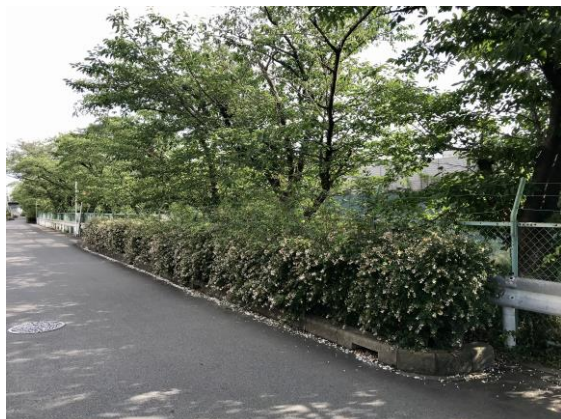
植栽の剪定要望をいただいて