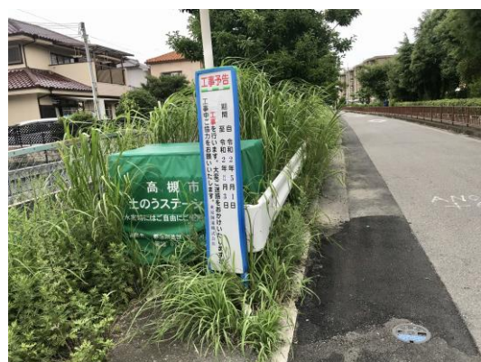
水路沿いの植栽剪定の要望をいただいて