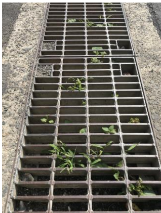
グレーチングのある側溝内の清掃要望を