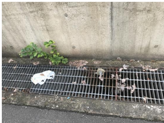
“高槻ポンプ場” 周辺の側溝清掃要望