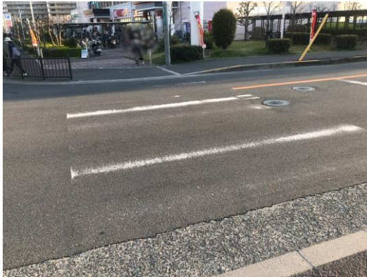
関西スーパーの交差点、横断歩道が薄くなって