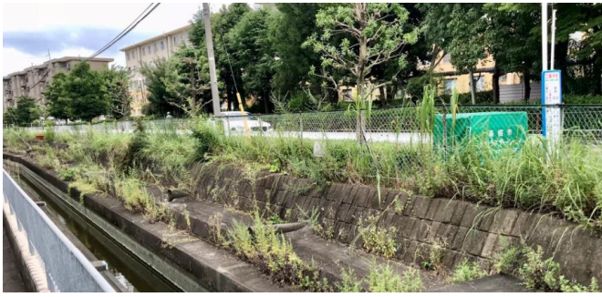
水路沿いに雑草が繁茂