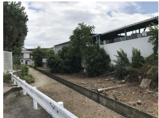
No.627 まずは、除草作業完了（登町）