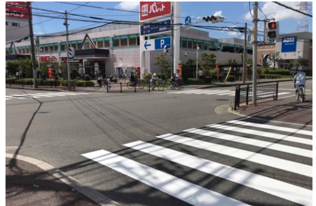
No.626 横断歩道等の補修完了（西冠3丁目）