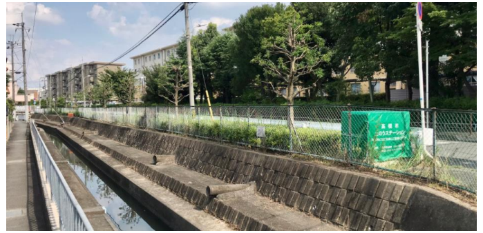
No.625 キレイに除草完了（登町）