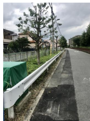
No.624 植栽と樹木の剪定が完了 (登町)

ホームページ http://www.komei.or.jp/km/takatsuki-yoshida-akihiro/