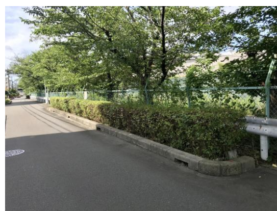
No.623 きれいに剪定が完了 (登町)