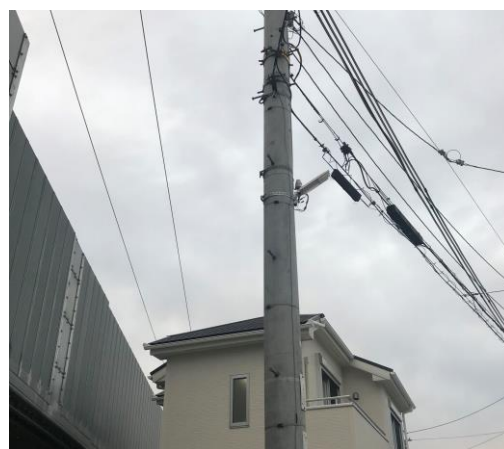
No.596 街路灯 3 箇所設置 (北大樋町)