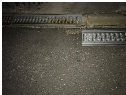
破損している側溝、機能果たせますか!?