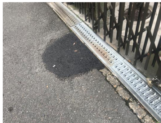
No.597 側溝の補修完成 (北大樋町)