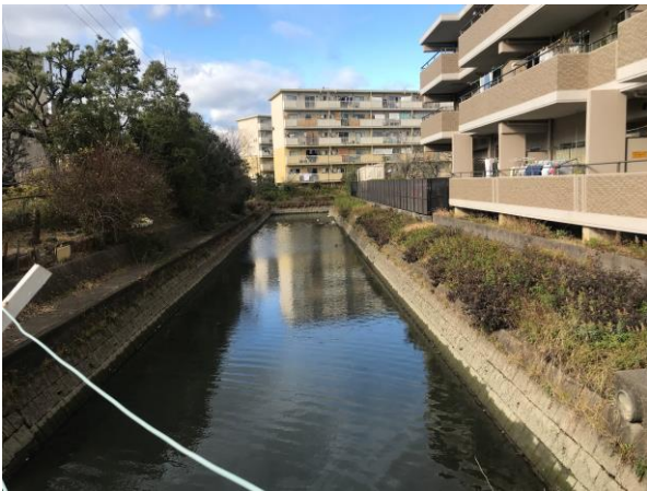
水路にゴミが溜まって…