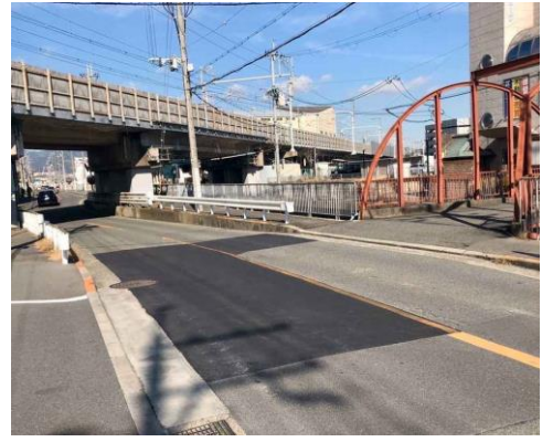
No.598 道路補修で路面の凹部解消(北大樋町)