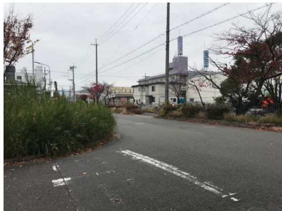
雑草で視界が悪い交差点