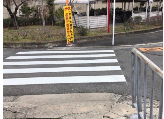
No.599 横断歩道の補修完了(深沢町)