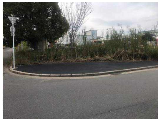
No.595 除草後に環境改善 (大塚町)