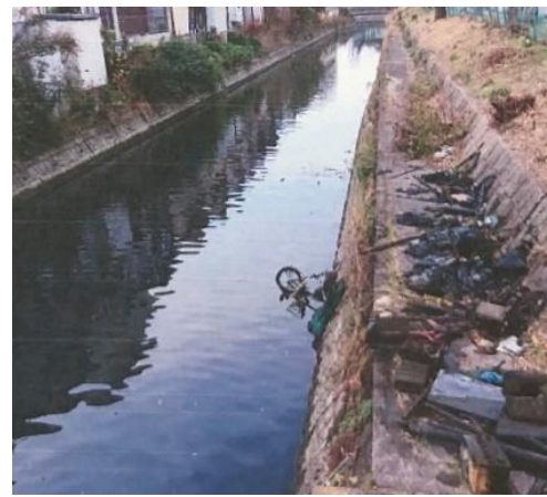
No.600 水路の清掃完了(登町)