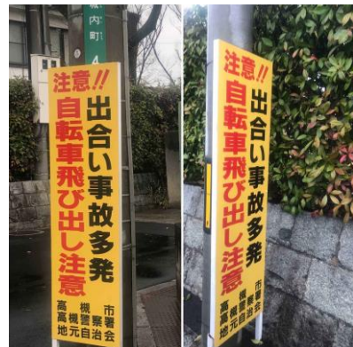
No.601 自転車の安全利用を啓発(城内町)