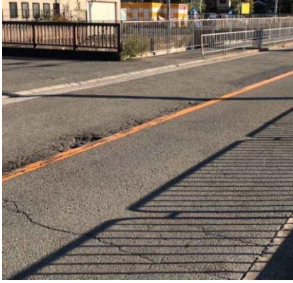
バス通りに凹部、振動の原因!?