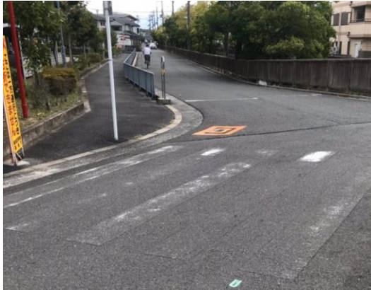
横断歩道等が薄くなってキケンでは!?