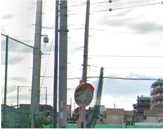
一方通行の道路、朝夕は自転車がが多く、暗い箇所もあって