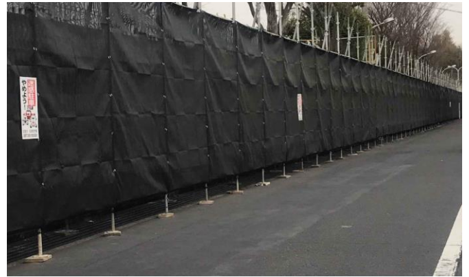
No.606 防塵ネットに啓発看板設置（堤町）