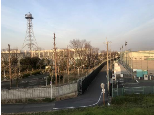
“高槻ポンプ場”工事中、路上駐車はご遠慮ください。