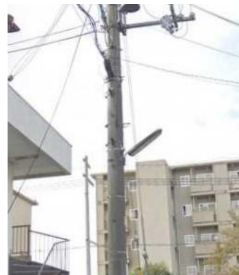
No.602 修理で夜道も安心 (登町)