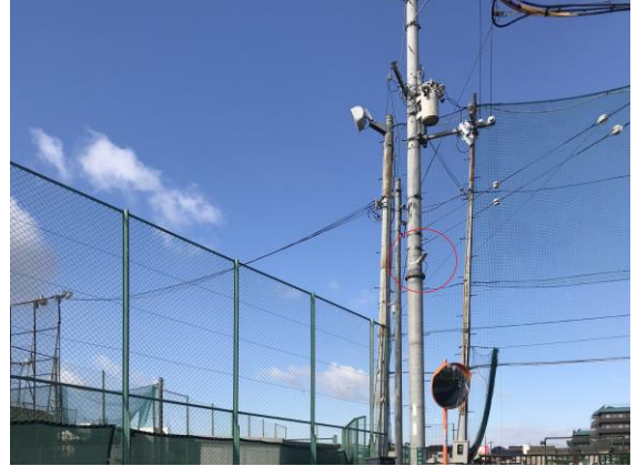
No.605 LEDの街路灯設置（城内町）