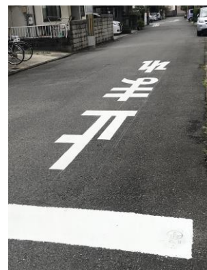
No.608 「止まれ」標示の補修（辻子3丁目）