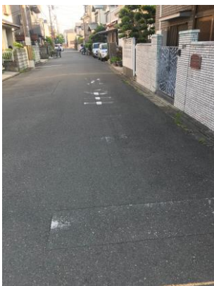
生活道路の路面標示が薄くなって