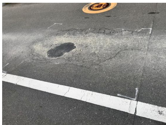
轍ができたキケンな道路。応急処置して...