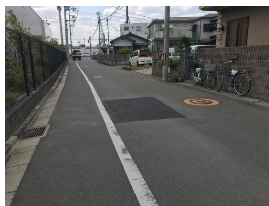
No.604 道路の補修が完了 (深沢町)