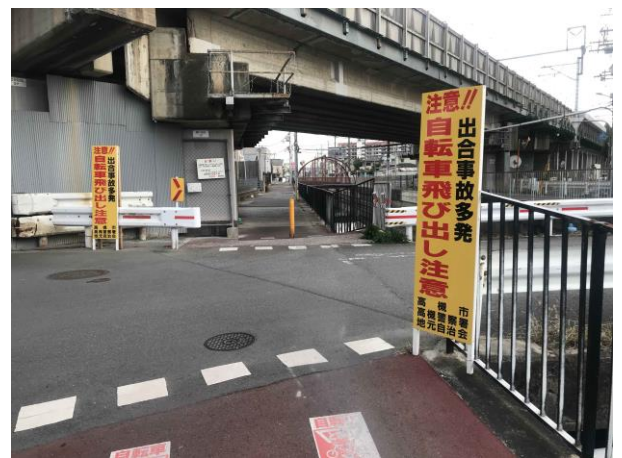
No.607 啓発看板で注意喚起（辻子3丁目）