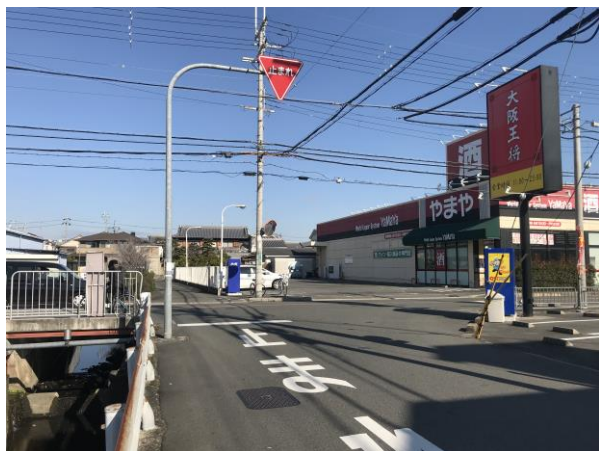
商業施設も増え交通量も。横断しにくい交差点