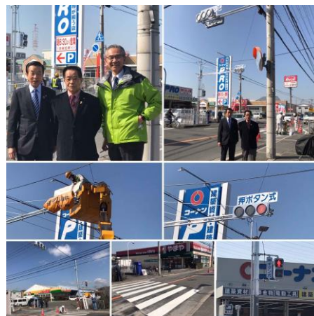
No.603 念願の信号機が設置(下田部町 2 丁目)