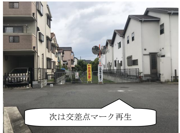
No.532 啓発看板設置（辻子3丁目）