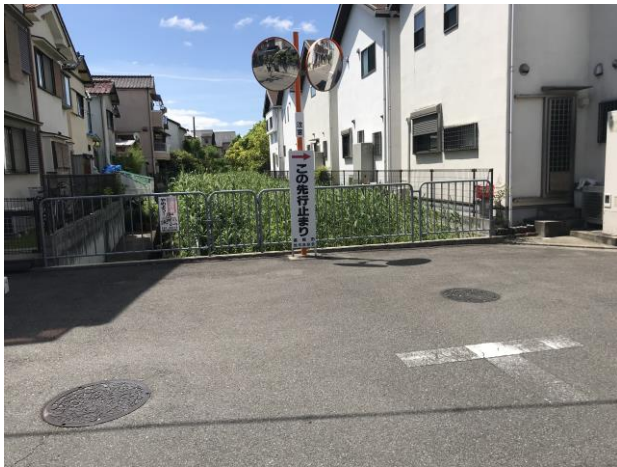
生活道路の安全対策要望