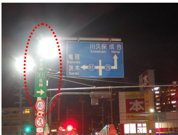
新名神案内板（縦型）わかりにくいとの声