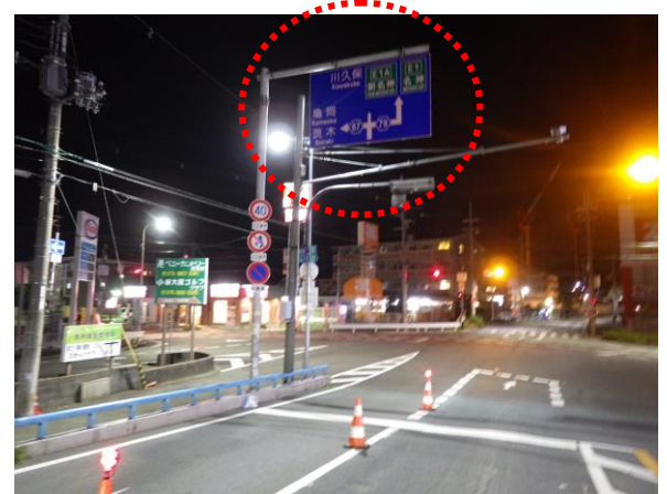
No.530 案内板改善（別所新町）

ホームページ http://www.komei.or.jp/km/takatsuki-yoshida-akihiro/