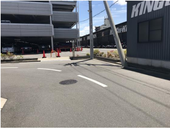
センターライン設置後（北向き）