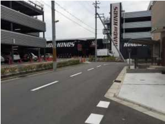
センターライン設置（南向き）