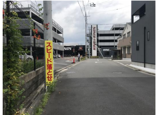
No.531 啓発看板設置（辻子3丁目）