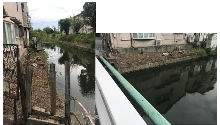
No.533 水路のり面樹木伐採（登町）