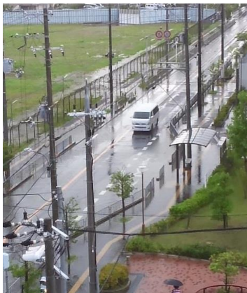
再度、バス停歩道の冠水（写真は前回）