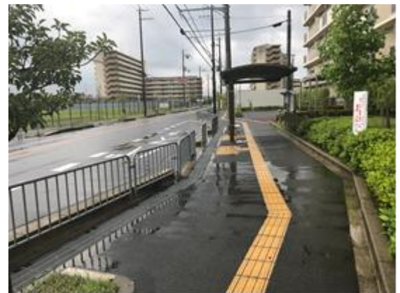
No.529 側溝の清掃で解消（深沢町）