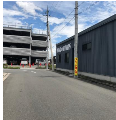
No.531 啓発看板設置（辻子3丁目）