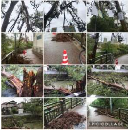
台風 21 号被害・水路、歩道に倒木