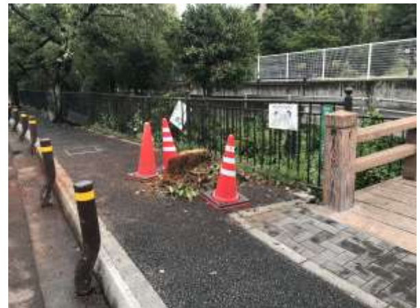
No.540 倒木撤去、安全確保（西冠3丁目）