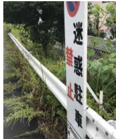
No.537 啓発看板、しっかり再設置（登町）

ホームページ http://www.komei.or.jp/km/takatsuki-yoshida-akihiro/