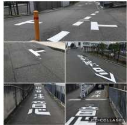
No.534 路面標示の補修完成（大塚町）