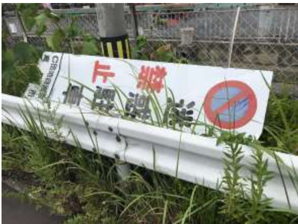
台風通過後、外れていると連絡