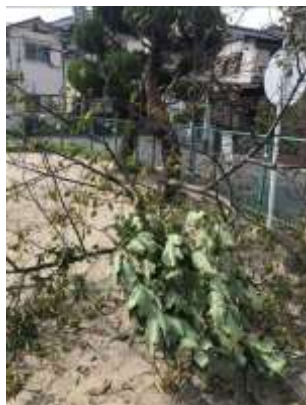
台風 21 号被害・公園で2本倒木