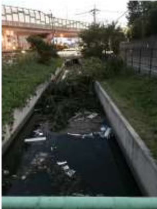
台風 21 号被害・水路に倒木