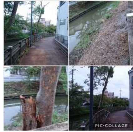
No.538 危険倒木の解消 共助・公助（辻子3丁目）