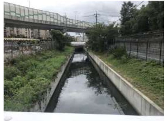
No.539 倒木撤去、二次災害回避（堤町）