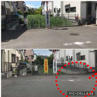
交差点マークの劣化・生活道路の安全安心要望