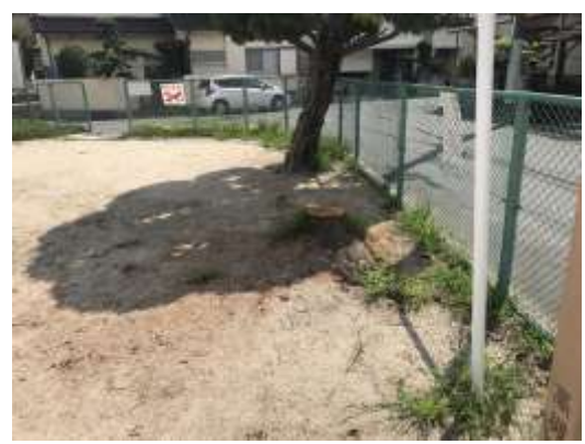
No.541 安全確保のため撤去（辻子3丁目）