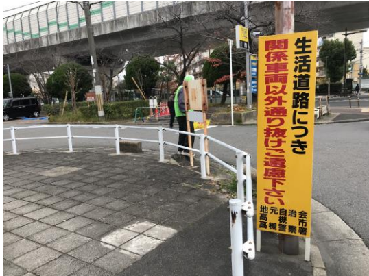
啓発看板が死角に