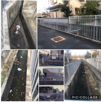
水路へのゴミ投棄で悩んで