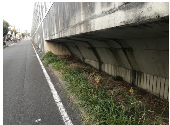
No.555 ゴミの撤去ができました(西冠3丁目)