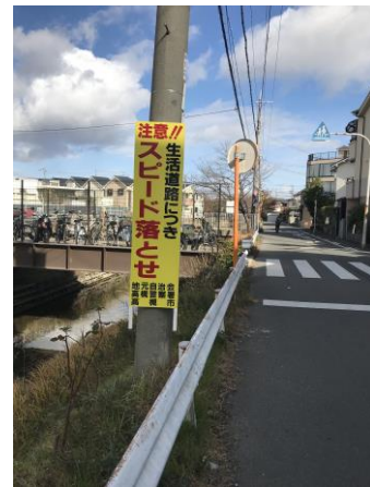
No.554 生活道路の安全対策（竹の内町）