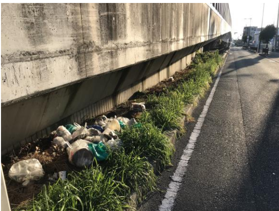
不法投棄はダメ!!（府道沿い）