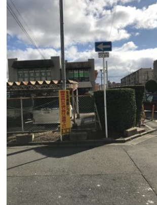
No.553 啓発看板の移設が完了（登町）