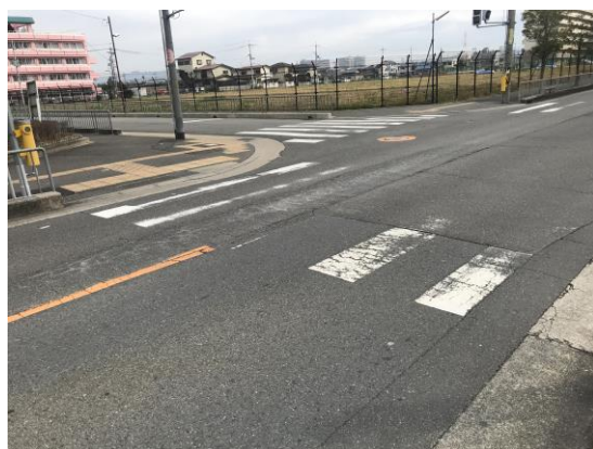
横断歩道が薄くなって轍も