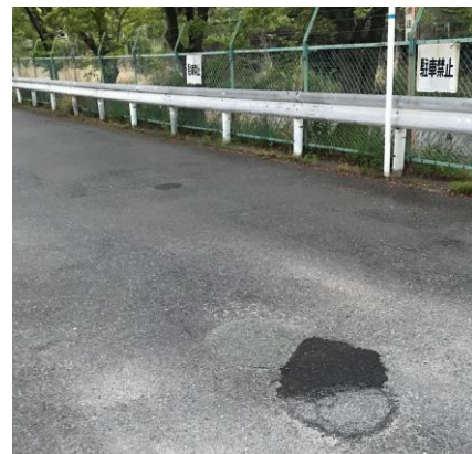
No.614 応急処置で確認中（登町）