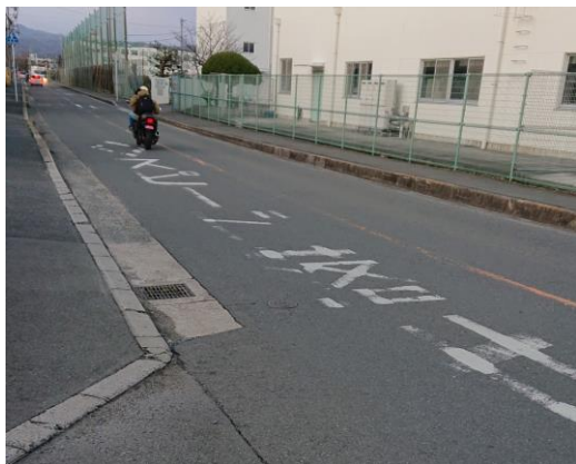
中学校前の道路標示が薄くなってキケン