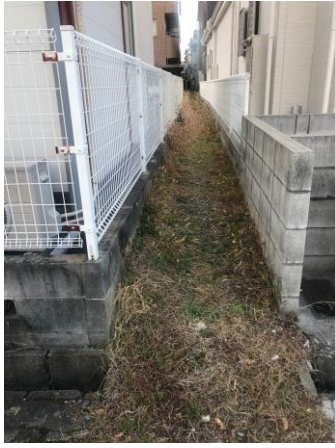
狭い小道は、雑草が繁茂してで通行できず