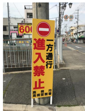
No.610 「進入禁止」看板の補修(深沢町)