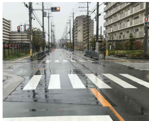
No.611 横断歩道と轍の補修(深沢町)