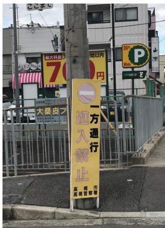
啓発看板が老朽化