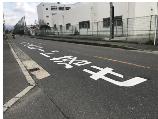
No.609 「スピード落せ」補修完了(竹の内町)