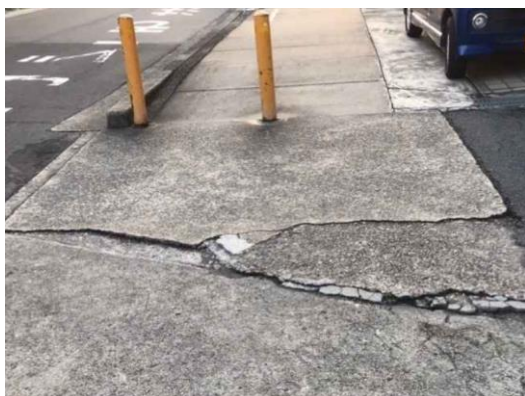
歩道（暗渠）に段差、高齢者の方は歩きにくく