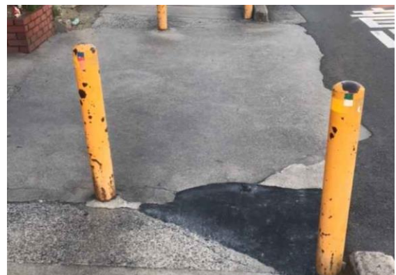
No.615 歩道の段差解消（大塚町）