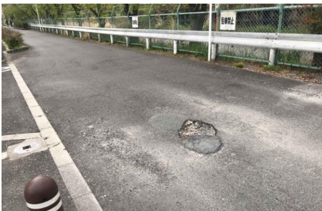
一方通行の道路に凹部、非常にキケンな状態