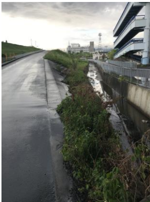
水路沿いの坂道は車とすれ違い非常にキケン