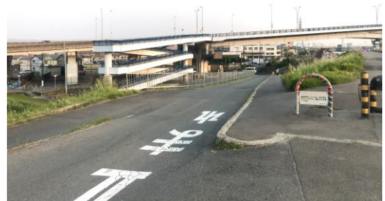
No.613 除草と落下防止策設置（堤町）