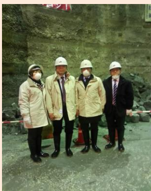
博多駅までの延伸工事が進む、地下鉄七隈線を視察。