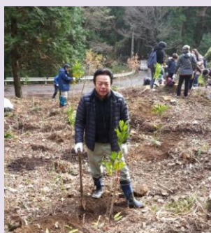
11月25日、森と海の再生交流事業で早良区の森林で植林作業へ。