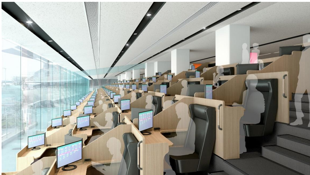
<イメージ図（改修後）>