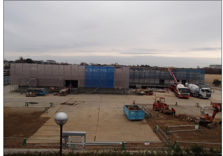
令和5年2月（外装及び内装工事等）