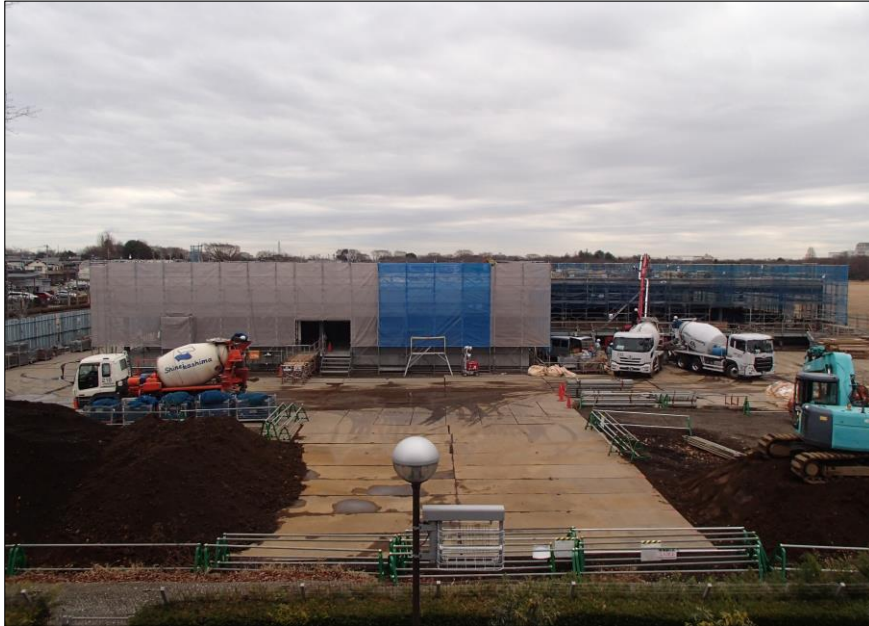
令和5年1月（躯体工事、外装工事等）