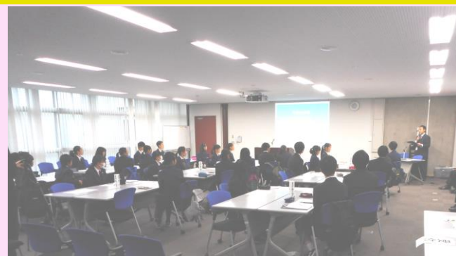
①現状 ②地域にあるネットワーク ③今後の中学生の取組