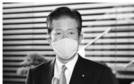
自公党首会談後、記者団の質問 に答える山口代表 ＝4月15日 首相官邸

山口代表は2020年4月15日、 安倍首相へ直談判。その行動 が政府を動かし、10万円一律 給付を実現しました。