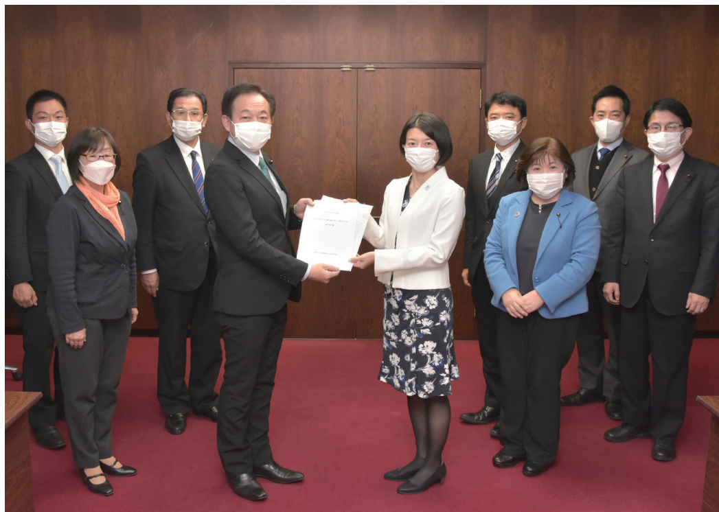
公明党品川総支部は、令和4年12月19日、森澤品川区長に、来年度(2023年度)予算に盛り込むべき政策511項目を要望しました。特に、以下の5項目に対しては強く実現を求めました。

● 学校給食の無償化 ● 高校3年生世代までの医療費無償化 ● 出産子育て応援交付金の早期給付など