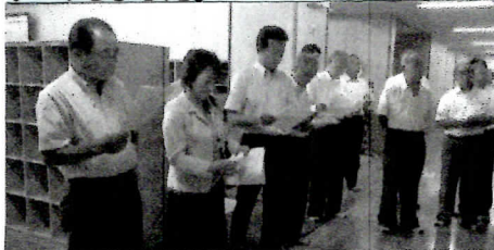
8月25日 七葉小学校一階の教務室前