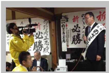
市議選で地元テレビの取材