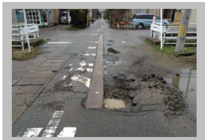
市道の道路点検を（14年3月）

カードの普及によって、障害に対する理解にもつながるものと認識している。一方でカードの認知度を高めていかないと実効性につながらない。地域自立支援協議会で導入に向けて、意見等を聞いていきたいと考えている。