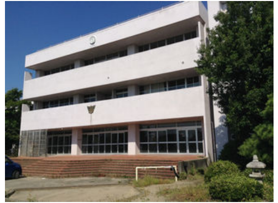
旧南小学校の校舎

9月定例会で、ものづくりに携わる者の新たな連携及び交流の場を提供し、新商品等の開発の促進及び次代のものづくりを担う人材育成の支援を行うとともに、ものづくり活動を通じた地域交流の促進を目的にした三条市ものづくり拠点施設を設置する条例が制定されました。旧南小学校は桜木町にあり、平成27年4月に開設予定されています。また、青少年育成センターや男女共同参画センターも共用します。