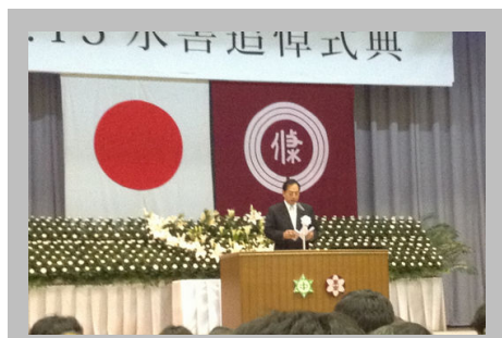
太田昭宏国土交通大臣 (7.13)