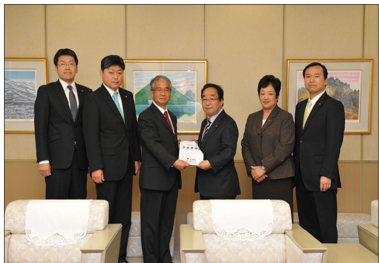
富岡市長へ 平成25年度予算要望書を提出 (24年10月29日)