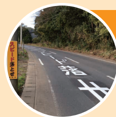
交通安全標示 の設置