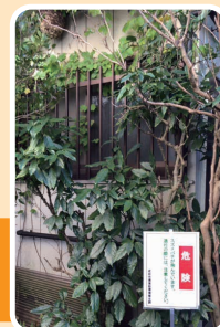
スズメバチの 巣の駆除