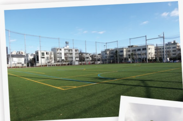
▲ 本五ふれあい公園