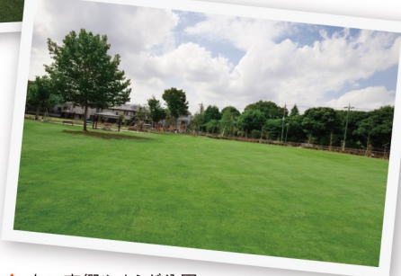
▲ 本二東郷やすらぎ公園