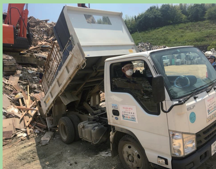
現地でトラックを運転し、廃棄物処理