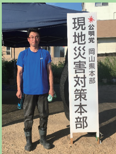
現地で公明党災害対策本部が設置

近年の異常気象で、想定外の災害が多発。 昨年8月に西日本豪雨で最も被害が大きかった岡山県倉敷市真備町で 災害ボランティアに参加し、被災状況を目の当たりにしました。