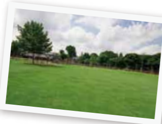
▲本二東郷やすらぎ公園