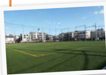
▲本五ふれあい公園