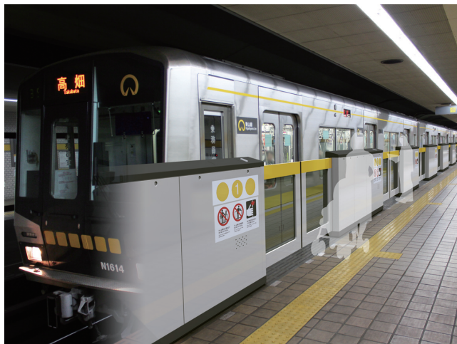
地下鉄東山線「可動式ホーム柵」の設置イメージ