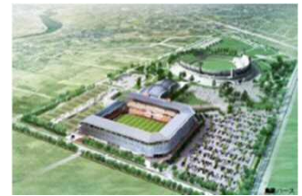
南長野運動公園サッカースタジアム