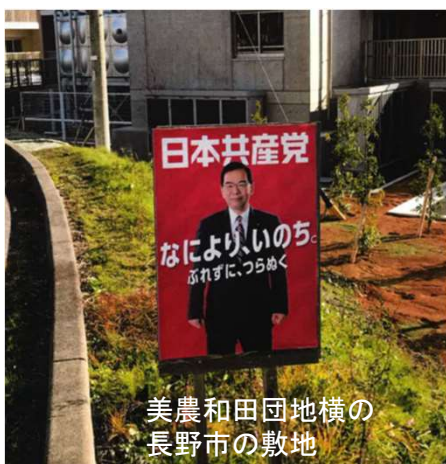
美農和田団地横の 長野市の敷地

※後日、12月15日に行われた総務委員会で、「#比例は共産党」と記載された掲示物について、共産党委員より「#比例は共産党は選挙違反ではない。」との発言がありましたが、選挙管理委員会から「問題があると考え。一般的に#比例は〇〇党と書かれていれば、普通の人は比例代表の投票は〇〇党へと考える。事前運動になる可能性があり、県に相談した。」という趣旨の発言がありました。