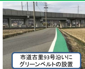
市道古里93号沿いにグリーンベルトの設置