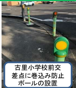
古里小学校前交差点に巻き込み防止ボールの設置