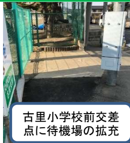
古里小学校前交差点に待機場の拡充