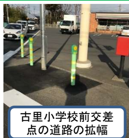
古里小学校前交差点の道路の拡幅