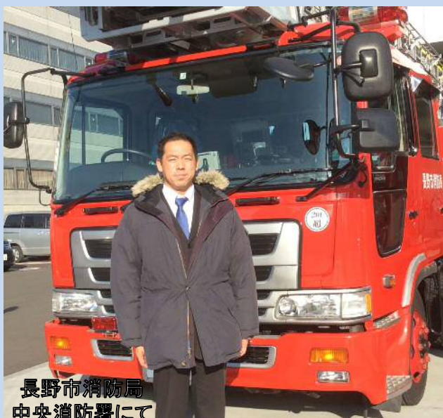
長野市消防局 中央消防署にて