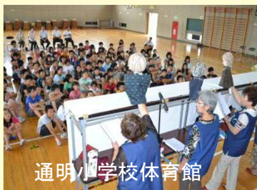
通明小学校体育館

きょう聞いたことを思い出し、優しく接してあげてほしい」と呼び掛けました。参加した女子児童の一人は「ひいおばあちゃんが認知症だけど、どう接したらいいか分からなかった。ひいおばあちゃんが間違えても、冷たくしないで温かく接してあげる」と話していました。