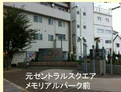
元セントラルスクエア メモリアルパーク前

(iPad)から高速インターネットが2週間無料で利用できるWi-Fiサービスを提供することになりました。IDとパスワードを記したカードはJR長野駅観光情報センターと松代観光案内所で配布されます。インバウンド対策が強化されました。