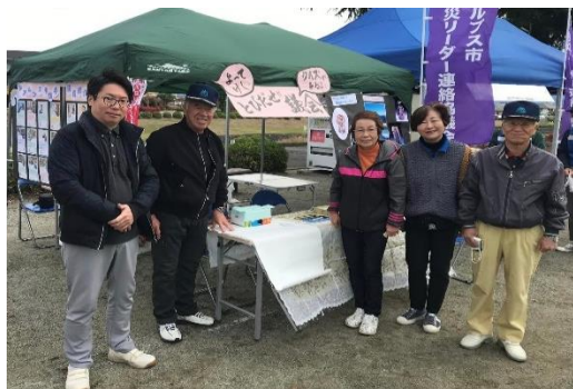
令和5年11月の市民活動フェスタに参加