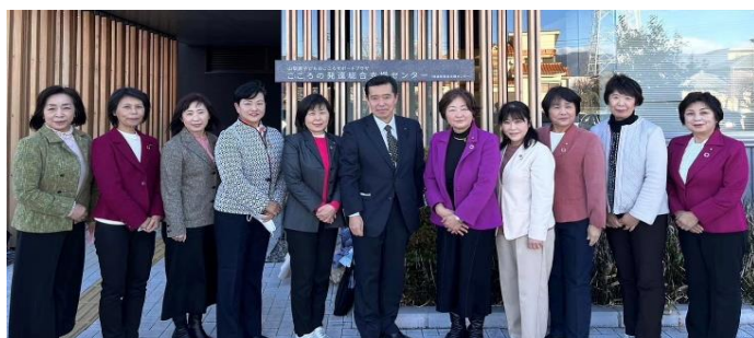
令和6年1月16日山梨県子どもこころサポートプラザ訪問