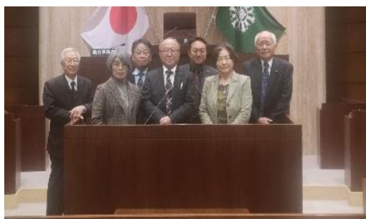
令和6年1月産業土木委員会視察（日進市）