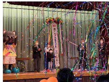
R4年3月の子ども子育て応援宣言

検討を考えるとの答弁から、R4年の6月議会に補正予算が組まれ、4月にさかのぼって無償になりました。