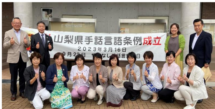
令和5年9月23日手話言語の日制定フォーラムに参加