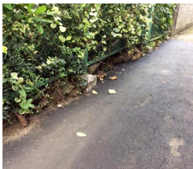
仲町町内会の道路の起伏で 通行が危険な個所の修繕