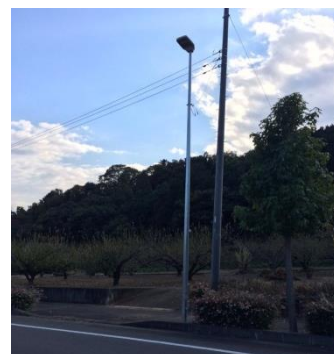
下：山際団地西の山側には今まで街灯が無く暗いとの要望から、1本街灯が設置