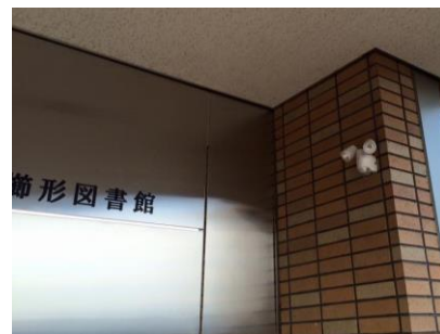
上：閉館後の櫛形図書館が暗く危険と、センサーライトが設置