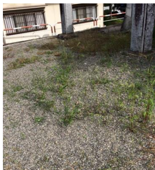
曲輪田地区の豪雨の際の陥没箇所 の修繕