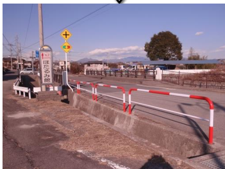
新上野橋の側溝への柵を設置