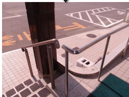
市庁舎玄関前の手すりを改善