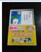
泉大津市版防災かるた

A 女性の割合は17.5%。40%を目指す。 女性防災士の育成研修については、今は考えていない。