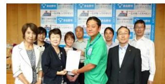
泉佐野市長に提出

「広域による産後ケア体制の構築を求める要望書」を 8 月 19 日、20 日の 2 日間に渡って、泉佐野市、泉南市、阪南市、熊取町、田尻町、岬町の各首長に手渡し、妊娠、出産、育児における切れ目のない支援を広域で取り組んでいただけるように要望いたしました！