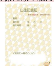
泉南市の出生記念証

答 今後、新たな子育て支援策や既存事業の充実を進めていく中で、研究していきたい。