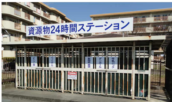
善光寺団地に常設中 「資源物24時間ステーション」