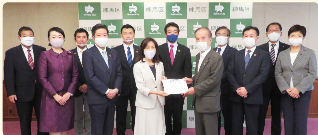
▲令和2年10月30日要望書提出