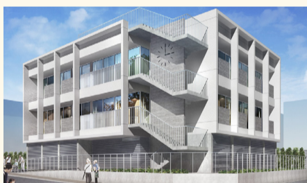
▲重度障がい者グループホームイメージ

この施設は、介護する方が急病等の場合にも障がい者を24時間緊急で受け入れられるショートステイと相談体制を備えた「多機能整備型」の地域生活支援拠点として整備されます。