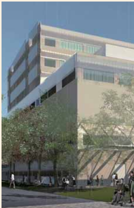
新練馬光が丘病院(イメージ)