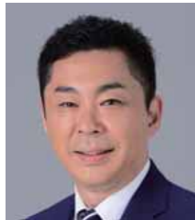
公明党練馬総支部長 東京都議会議員