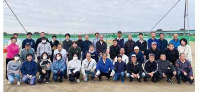
ひまわり会の皆さんと花火大会翌日清掃ボランティア(10/8)