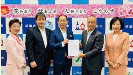
市長に令和6年度予算要望書を提出(10/10)