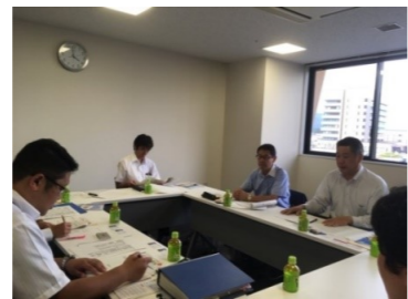
6/26 平成27年竣工の岡谷市民病院を視察(25～26日 浜松市・横浜市も会派視察)