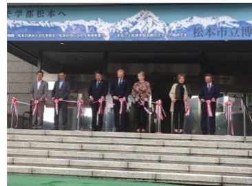
6/16 博物館特別展「チェコの城と宮殿」オープニングセレモニー