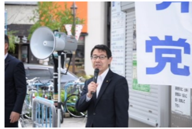
5/3 憲法記念日の街頭演説