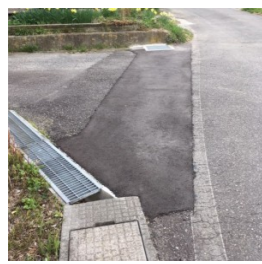
排水用水路ますと排水パイプを設置(梓川)