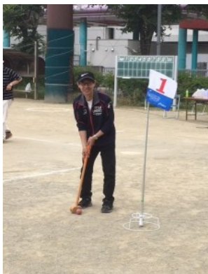
6/10 島内小宮三町会グランドゴルフ大会