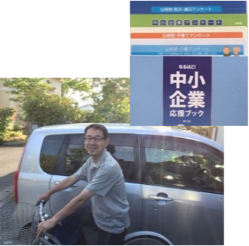
介護サービスや子育て等の訪問調査運動に。約350名の方にご協力いただきました。