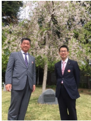
4/6 中国大使館観桜会