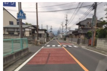
消えかかっていた横断歩道の再舗装とカラー舗装(島内)