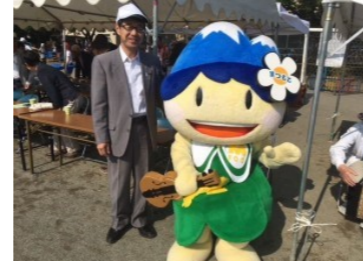
6/2 島内小学校運動会