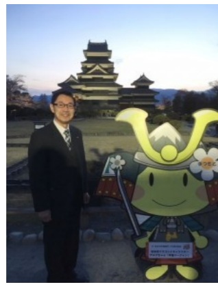
4/10 松本城本丸庭園の夜桜会