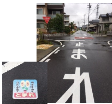
「止まれ」・「とまれ」表示舗装(島内)