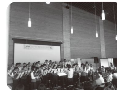
さわやか軽井沢交流会へ