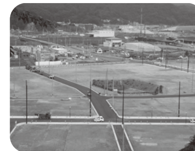
大槌町へ4度目の視察訪問