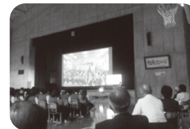
からまつ祭でのスカイプ