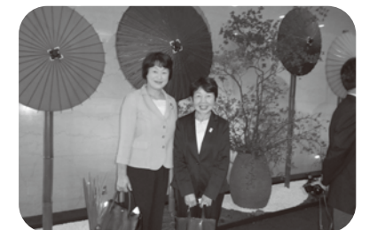
G7交通大臣会合の会場にて