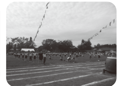
中部小学校運動会の応援